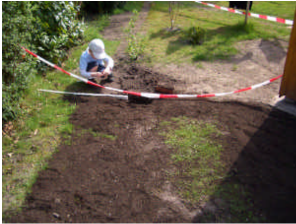
Position Wassermuffe Durchgang hinten