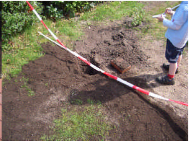
Position Wassermuffe Durchgang hinten