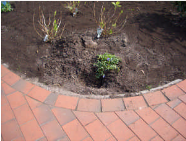
Position Wassermuffe vorne

Wasserstrang unter Pflaster vorne ins Beet ist wg. Undichtigkeit stillgelegt. Abklemmstelle unterhalb Carporttür.