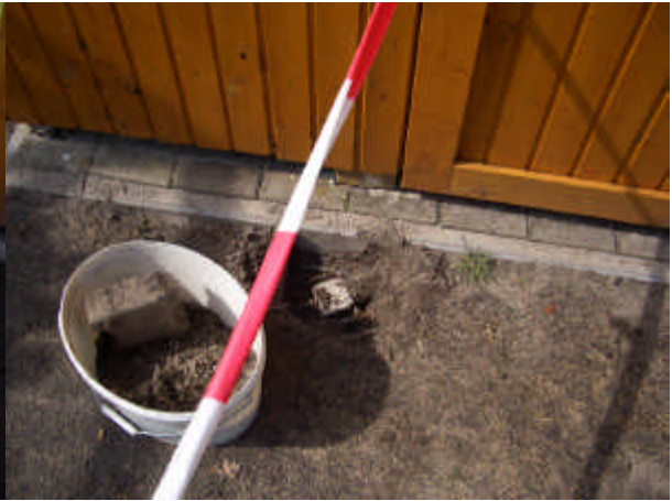
Position Wassermuffe Carporttür