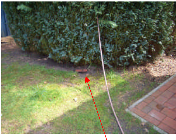
Position Wassermuffe Kompostplatz