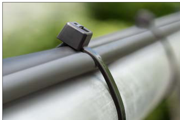
UV witterungsstabile Kabelbinder der T-Serie (PA66W).